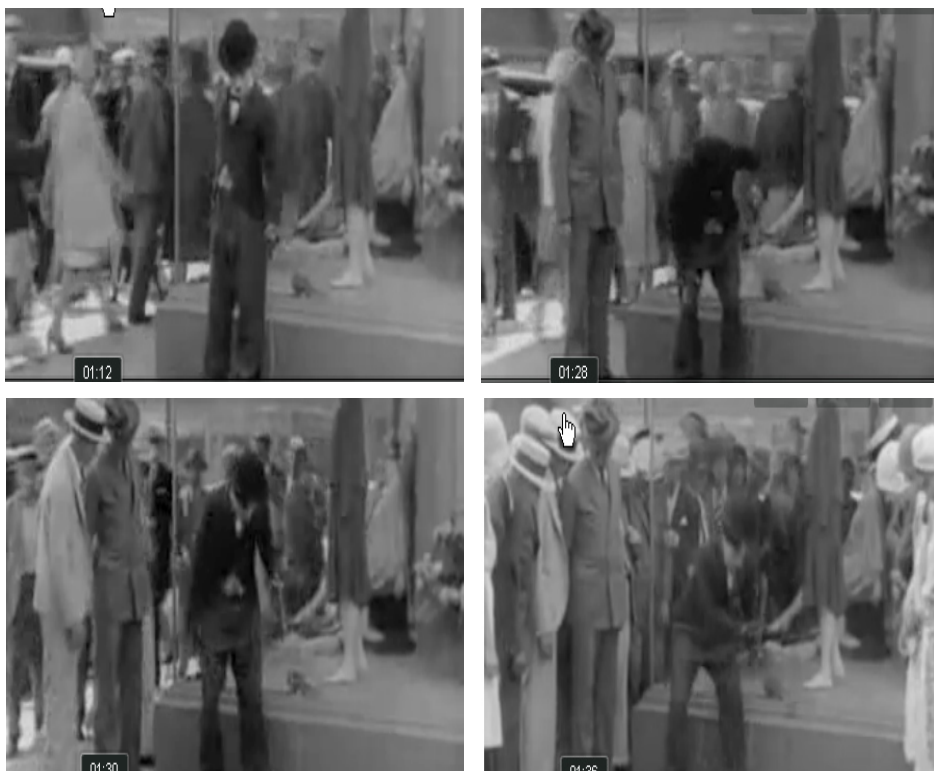
FIGURA 2 DESARROLLO CINEMATOGRAFICO DE LA ESPECTACULARIDAD

La vertiente especular queda de manifiesto ahí donde se halla reciprocidad entre los espectadores que ven una misma función representada: yo soy espectador de la función que otros expectantes pretenden ver y, viceversa, otros son espectadores de la función en la que yo soy un expectante más. Adviértase ahora que esa relación especular es recíproca y reflexiva a la vez, de manera que es la expectación de la función representada la que queda incluida en la función donde yo aparezco como expectante y, viceversa, mi expectación queda incluida en la función donde otros aparecen como espectadores.