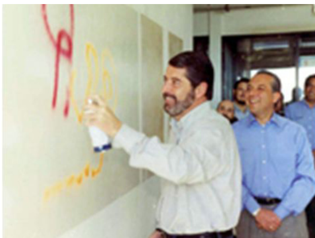
FIGURA 2 PRESENTACIÓN DEL ANTIGRAFFITI