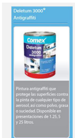
FIGURA 4 PRODUCTO ANTIGRAFFITI COMERCIALIZADO