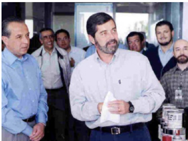
FIGURA 3 OBSERVANDO LOS RESULTADOS DEL ANTIGRAFFITI