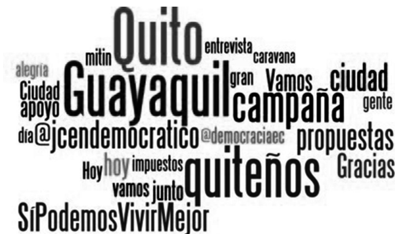
GRÁFICA 2 LAS 25 PALABRAS MÁS TWITTEADAS POR SIETE POLÍTICOS ECUATORIANOS DURANTE LA CAMPAÑA 2014

La gráfica 2 registra las 25 palabras que aparecieron con mayor frecuencia en los 1 614 tweets de los políticos analizados en este estudio. La gráfica muestra la importancia de la referencia a las dos ciudades en que la disputa electoral era más relevante para los actores: Quito, quiteños y Guayaquil. Esta primera aproximación muestra referencias genéricas (“alegría”, “vamos”, “ciudad”, “apoyo”, “gracias”, “propuestas”). Unas pocas palabras pueden entenderse en referencia directa a lemas de campaña (“Sí podemos vivir mejor”) y agrupaciones (@jccendemocraico / @democraciaec / @movimientovive), aunque las mismas no expresan referencias directas a partidos o movimientos políticos (sólo a @movimientovive).