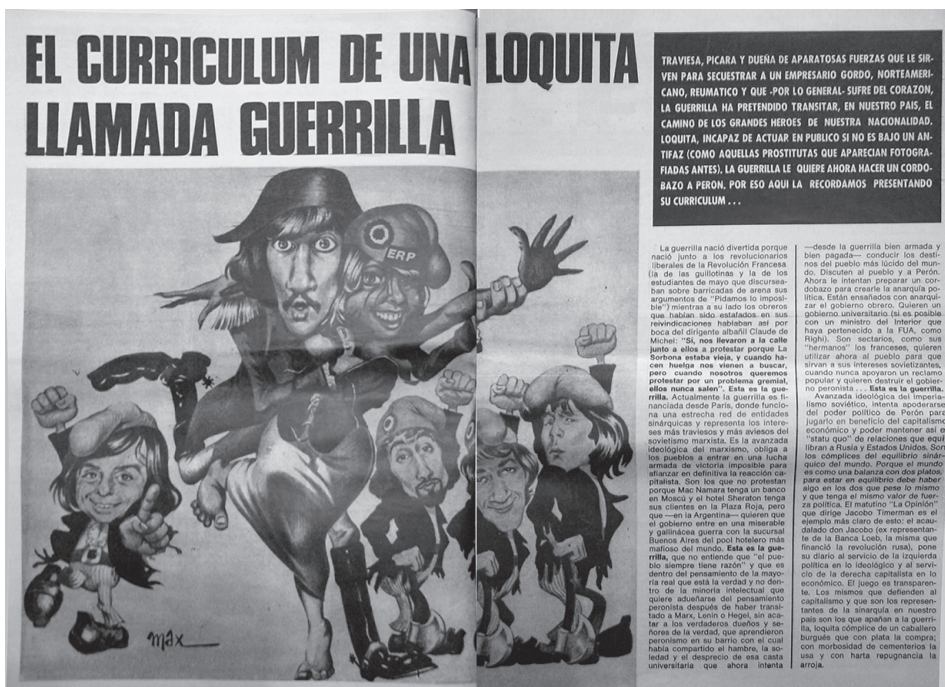
FIGURA 4 CARICATURAS DE LÍDERES DEL PARTIDO REVOLUCIONARIO DE LOS TRABAJADORES, MONTONEROS Y LAS FUERZAS ARMADAS REVOLUCIONARIAS