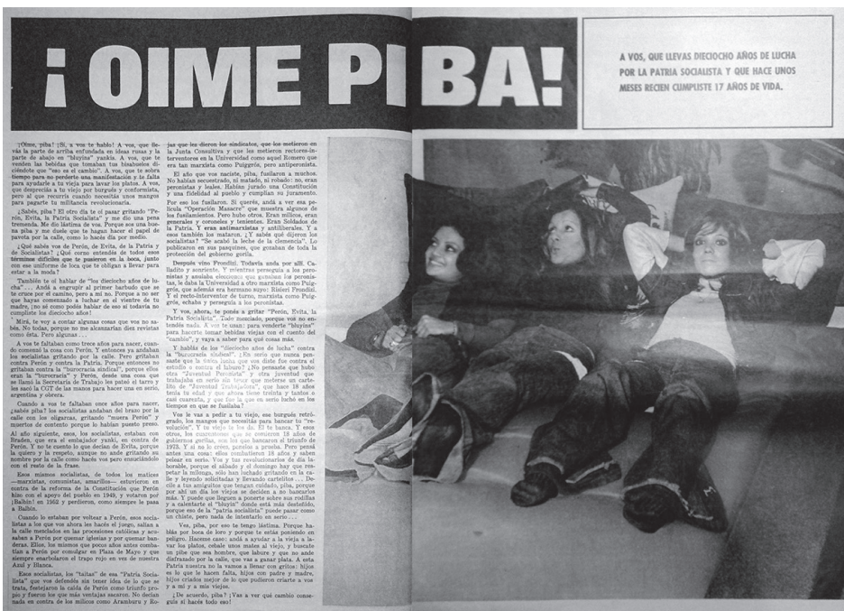
FUENTE: El Caudillo 1, 16 de noviembre de 1973, páginas 10-11.

El artículo —titulado “¡Oíme piba!”— se dirigía con violencia a una de esas muchachas porque había desconocido su “verdadero” lugar de género y clase. Ellas, como muchas de las jóvenes militantes de la Juventud Peronista hegemónica por Montoneros, habían salido de casa y se habían politizado. El interlocutor construido —también varón, adulto y trabajador— asumía la voz de un padre que debía poner en su lugar a las muchachas que, supuestamente como su hija, debían estar en la cocina en vez de militando y pidiéndole dinero para hacerlo, mientras lo tildaban de “burgués y conformista”. Era una condena simbólica de las jóvenes que intentaban escapar al destino de su clase. Hilvanaba una nueva versión de las “costureritas”, perdidas moralmente al ser atraídas por el centro de la ciudad, como habían imaginado el folletín y el tango de comienzos de siglo XX. Pero en este caso el peligro era que fuesen “usadas” política y sexualmente, como proponía la fotografía, por lo que