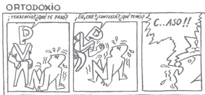
FIGURA 6 “ORTODOXIO”, TIRA HUMORÍSTICA DE EL CAUDILLO