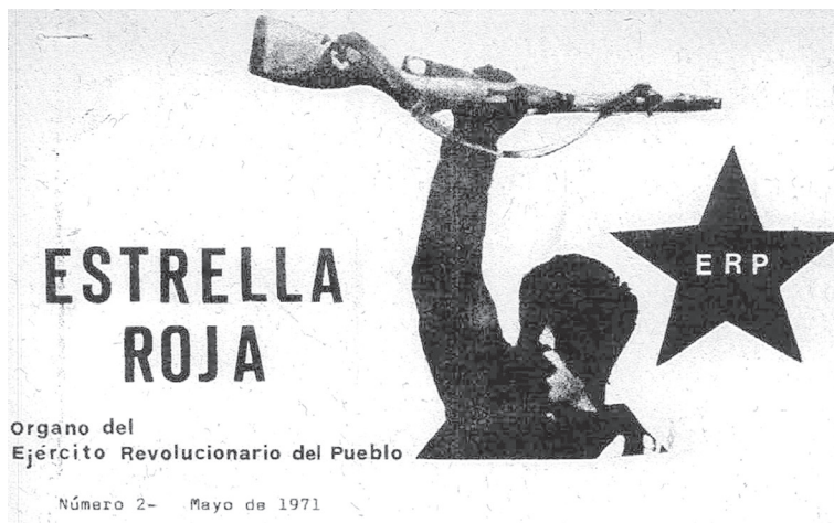
FIGURA 1 LOGO DE ESTRELLA ROJA , ÓRGANO OFICIAL DEL EJÉRCITO REVOLUCIONARIO DEL PUEBLO