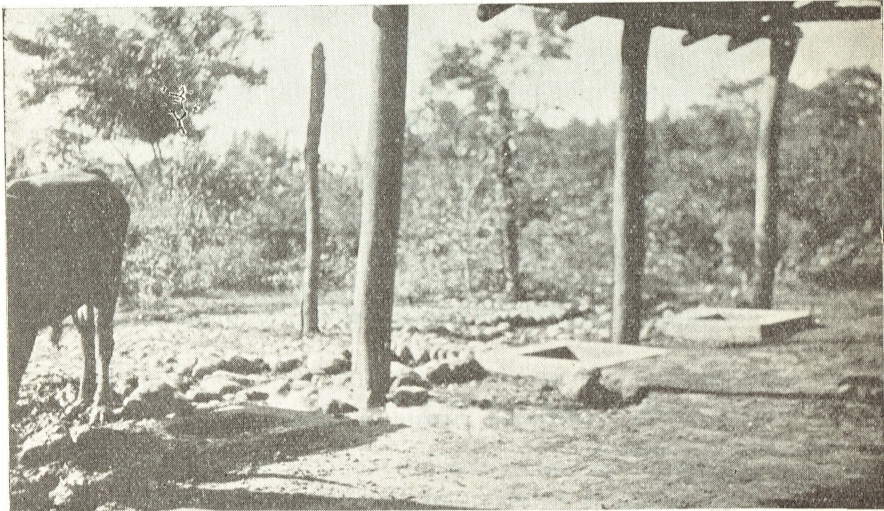
La higiene (?) en los rastros de la población rural en las piletas a raíz del suelo se lava la carne.

Como se ve en muchos de los capítulos señalados, algunos hay que no pueden ser resueltos de manera eficiente y otros en los que ha de enfocarse de manera más decisiva la atención del pasante para que su trabajo sea más efectivo.