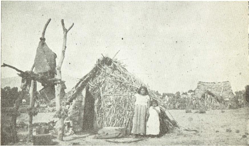
Tipo de chosa —ejemplo de insalubridad— que habitan nuestros campesinos. (Valle del Mezquital)

Leemos en el inciso de "aguas", y señalo éste por parecerme de los más importantes, que es rara la población que dispone de agua potable y que es la razón principal del alto índice de morbilidad y mortalidad. Jamás se habían practicado exámenes de las mismas antes de que el pasante en "Servicio" llegara a convivir con esas gentes a quienes encontró tomando cultivos de protozoarios y bacterias. Para la práctica de dichos análisis y servicios de laboratorio en general, la Facultad designa pasantes con los elementos indispensables para que reciban en esta Capital, las muestras que se envían del "Servicio Social" y practiquen las investigaciones requeridas.