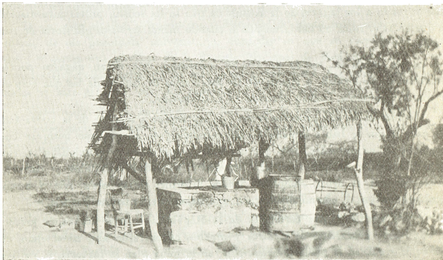
Tipo de noria en las "Estaciones de Servicio", de las que se toma el agua que se cree potable (?) y explica las parasitosis y endemias tíficas.

más común en el lugar". Algunos otros se acompañan de sugerencias felices para el saneamiento de campamentos de trabajadores y otros plantean problemas de higiene industrial, no previstos en nuestras factorías antes de la llegada del estudiante. Muchos señalan las endemias como motivo principal de su trabajo y dan el toque de alarma a las autoridades competentes que se han olvidado de tantos lugares como Zacapú, Mich., que es devorado por la lepra, según leemos en la tesis de Escobar (Nº 38, del Tomo III. T. R.)