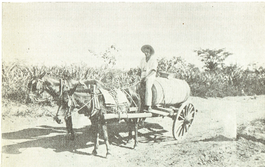
Manera de transportar el agua a la población que no sabe de tuberías ni avenamiento.

Todos los informes médico-sociales, en tres años de experiencia (37, 38 y 39), están divididos en capítulos que dan idea más o menos completa de la labor desarrollada y que en términos generales son los siguientes: