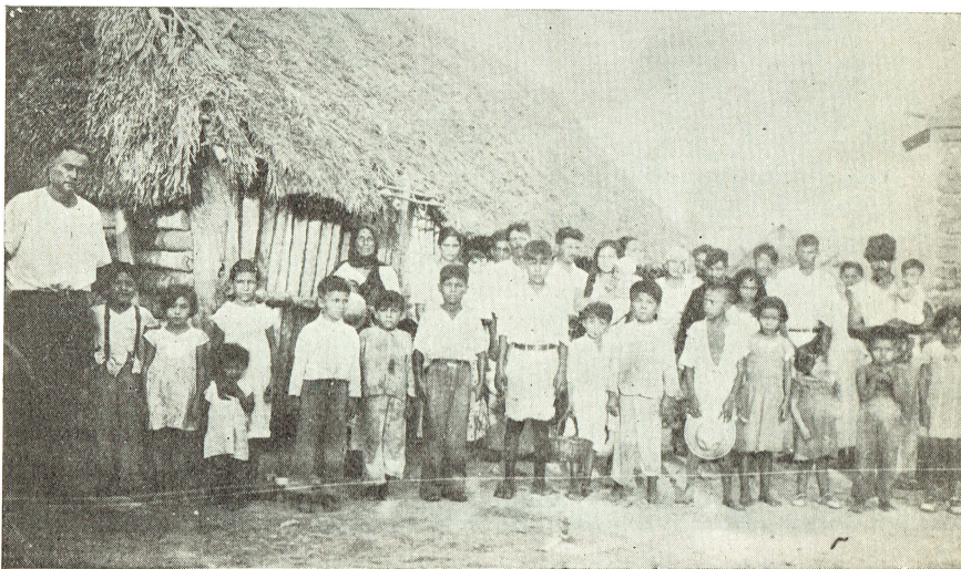
La sociedad real del México Rural, motivo del servicio y preocupación de la Escuela de Medicina. (Grupo de vacunados en prácticas médico-sociales en "Ruiz" Estado de Nayarit).

Los errores de creencia, con respecto a la mayoría de las enfermedades, son tales, que leemos en el capítulo relativo del Informe de Hernández (Acatzingo, Pue. 1939), lo siguiente: cuando se presenta un caso de viruela entre los habitantes de algún barrio y especialmente cuando el enfermo es un niño, acostumbran reunir a los demás infantes y llevarlos a visitar al enfermo, pues dicen que, si no hacen eso, las "viruelas" "se enojan" y se mueren los niños.