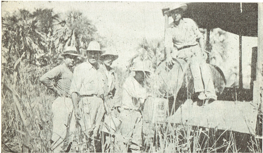
El pasante de medicina en Servicio Social, personalmente se ocupa de petrolizar los pantanos para librar a los campesinos del azote palúdico, éstos lo ayudan en su tarea

Es natural que gentes olvidadas, hasta ahora, del mundo civilizado, tengan conceptos erróneos acerca de las enfermedades y guarden las ideas más peregrinas con respecto a su origen, evolución y contagiosidad.