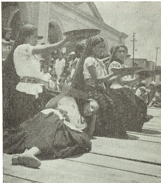
La Secretaría de Educación Pública cooperó al festejo con valiosos elementos artísticos.

Como centro de asistencia médica, atenderá con esmero, con eficacia, con estricto sentido de responsabilidad a los enfermos que acudan, no sólo proporcionándoles consulta gratuita, sino las medicinas indispensables en casos especiales, y llevando a cabo, en establecimientos adecuados de la Ciudad de México, operaciones y curaciones que requieran elementos de los que no se dispone en el local mismo del Consultorio.