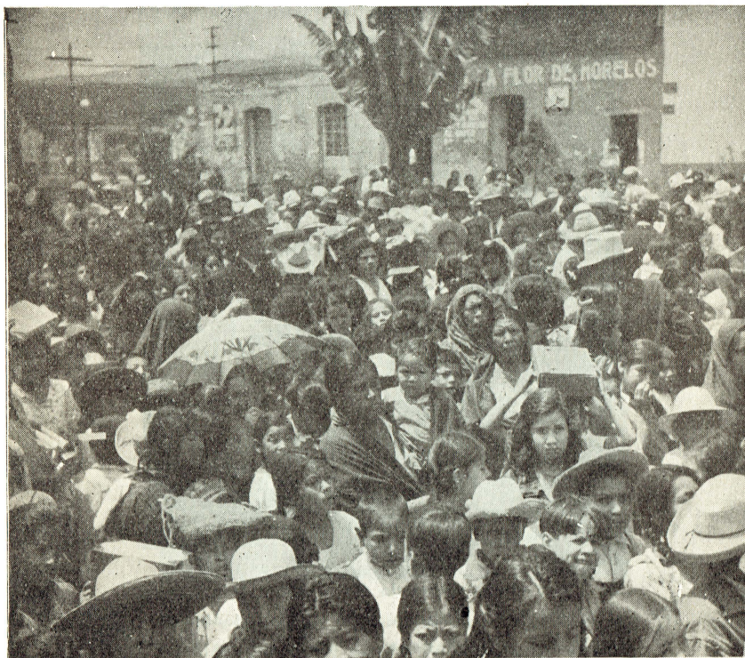
Un grupo de asistentes a la ceremonia de inauguración del Consultorio Gratuito en Xochimilco.

“La Universidad quisiera multiplicar sus esfuerzos de esta especie, llevar por todos los ámbitos del país sus instituciones de servicio colectivo; pero encuentra