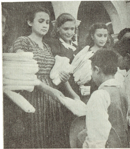
Bellas señoritas de la localidad repartiendo ropa a los niños pobres, en ocasión de la inauguración del Consultorio Gratuito.

El Consultorio Médico establecido por la Universidad en Xochimilco, además de prestar servicios de carácter profesional, siempre que sea requerido para ello por las personas necesitadas, será un centro de estudios e investigaciones.