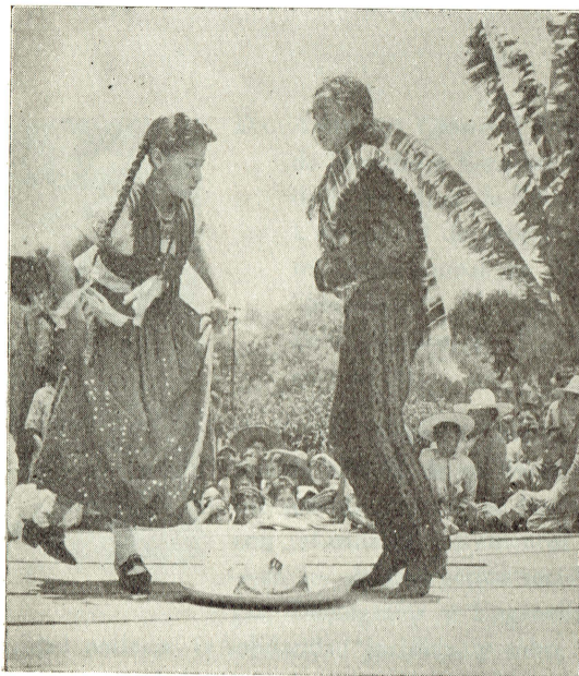
Un baile muy aplaudido.

El Consultorio cuenta con un programa preciso para el desarrollo de sus trabajos de investigación, y con una documentación previamente preparada para registrar los datos fundamentales: medidas antropométricas, observaciones fisiológicas, historias clínicas, etc., a fin de fundamentar sólidamente sus conclusiones.