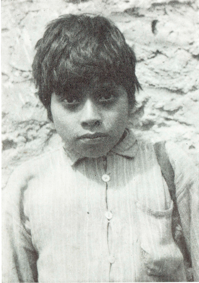
Niño chol de Tumbalá, Chiapas