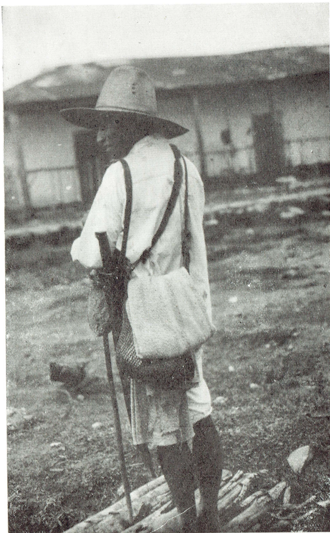
Hombre chol mostrando su indumentaria. Tumbalá, Chiapas