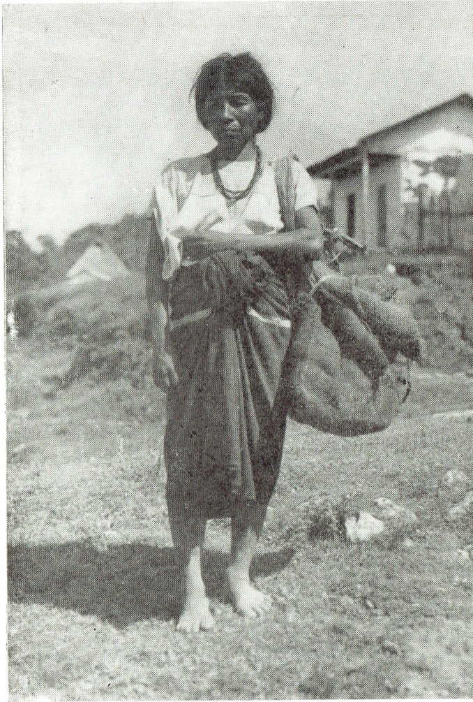
Mujer chol mostrando su indumentaria. Tumbalá, Chiapas