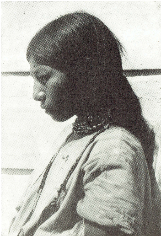
Niña de la región chol. Tumbalá, Chiapas