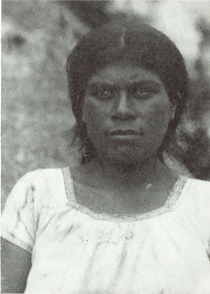
Tipo de mujer indígena chol. Hidalgo, Chiapas