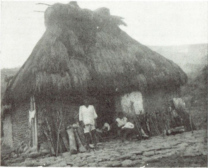
Tipo de habitación chol. Tila, Chiapas