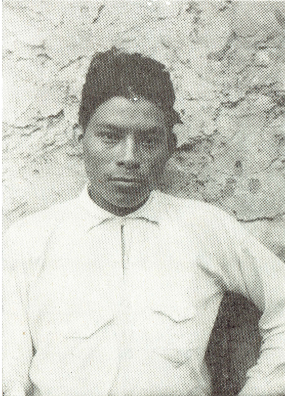
Joven indígena de la región chol. Tila, Chiapas