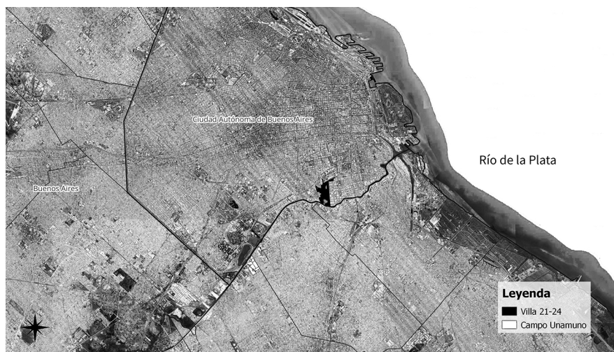
Mapa 2 Casos de estudio. Asentamientos informales de la Cuenca Matanza Riachuelo

densidad poblacional y verticalización respecto de la otra tipología expuesta. Ambos fueron afectados por políticas derivadas de la causa “Mendoza”: más de 1 300 familias debían ser relocalizadas de la ribera del barrio porteño, mientras que para los barrios lomenses se planificaron una serie de mejoramientos habitacionales, relocalizaciones y construcción de viviendas nuevas. Además, para ambos se preveían obras de agua y saneamiento.