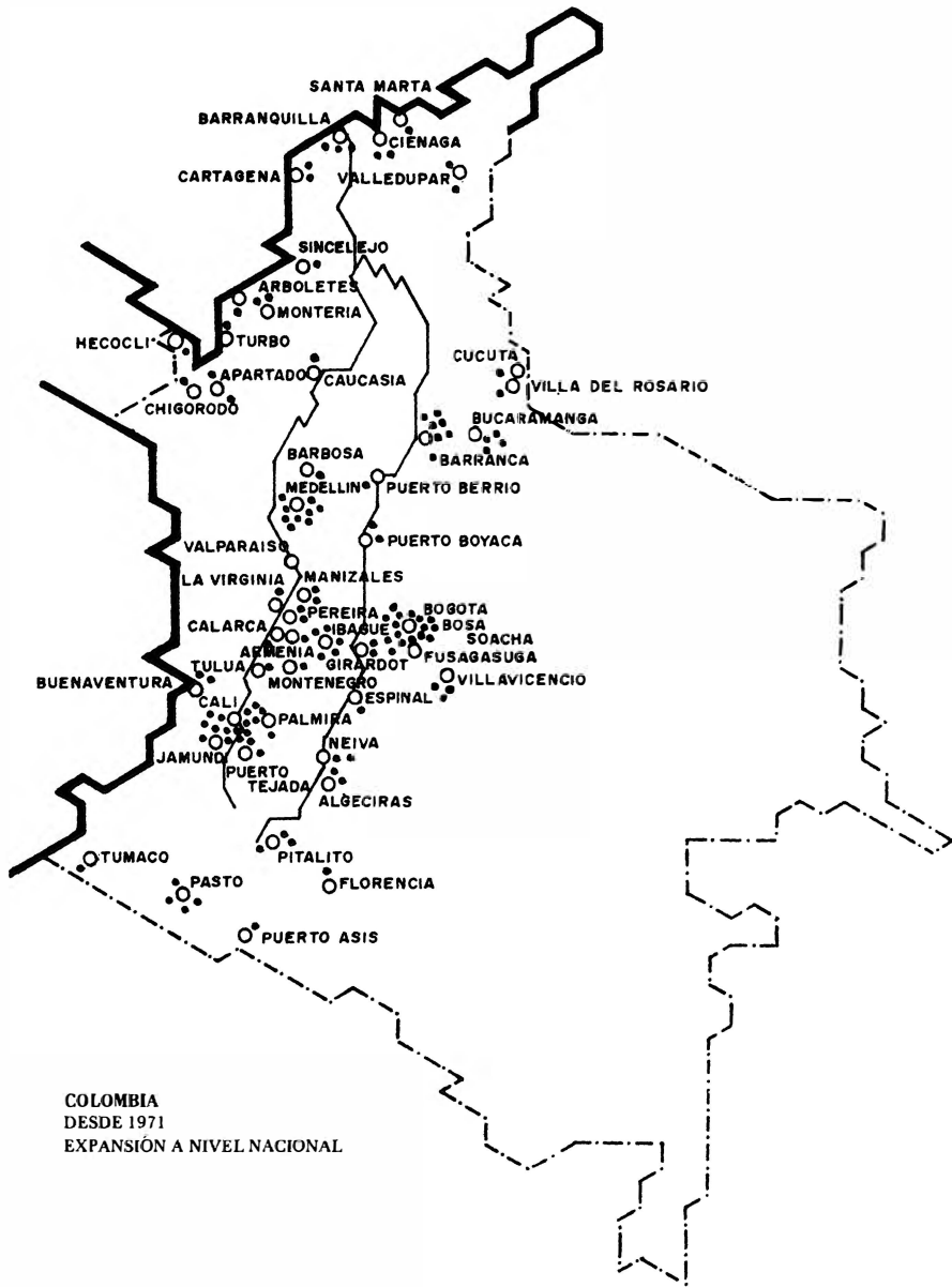
COLOMBIA DESDE 1971 EXPANSIÓN A NIVEL NACIONAL