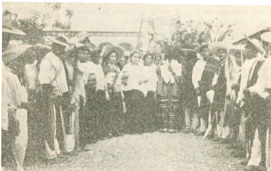
Recién casados a la salida del templo, aztecas de Tuxpan, Jal.

Las mujeres encinta eran atendidas por una clase especial de comadronas, que atendían a la embarazada dándole bebidas calmantes. Una vez efectuado el alumbramiento, era lavado y envuelto el niño, procediéndose después a una ceremonia que algunos compararon con el bautizo y que consistía en que el sacerdote procedía a hacer un horóscopo al infante. Adornaban la casa con flores, y si era hombre, se le ponía en la mano un arco y una flecha en miniatura, y si era mujer, un malacate y se pronunciaban palabras rituales sobre las futuras actividades de los infantes.