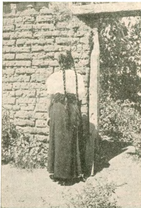
Mujer azteca de Tuxpan, Jalisco. Indumentaria regional

Las habitaciones eran de piedra pegada con lodo, adobe o carrizo, con techo de paja o de pencas de maguey como tejas. Generalmente constaban de una sola pieza y en su interior tenían un pequeño adoratorio y un lugar como