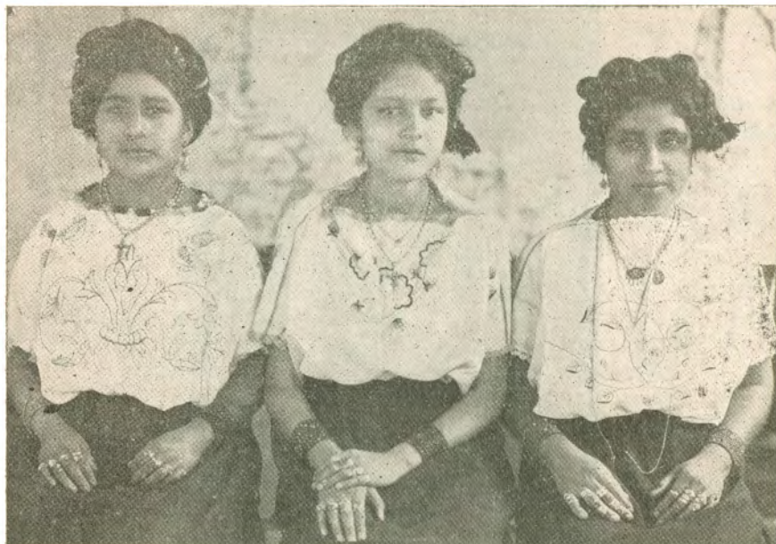
Indumentaria, peinados y adornos de aztecas, Tuxpan, Jal.

La principal construcción era el templo mayor o gran "Teocalli", que tenía forma piramidal, con construcciones menores a sus alrededores. Estas construcciones eran de una gran técnica y resistencia. Construían también fortificaciones, murallas y zanjas. Los caminos públicos se componían después de cada temporada de lluvias. Los mercados eran notables por lo bien