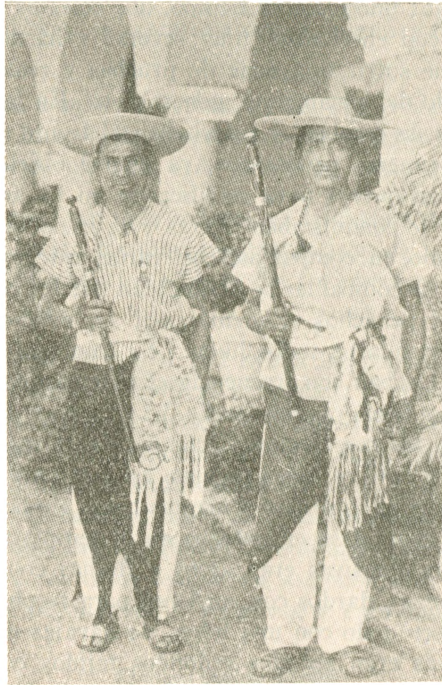
Aztecas de Tuxpan, Jal. Autoridades indígenas

avanzadas del ejército mexicano. Se podía ser comerciante únicamente con permiso real, fuera de la sucesión hereditaria. Aprendían el idioma del lugar que trataban de conquistar y se establecían entre ellos, siendo sumamente respetados e inviolables, dándose el caso de guerras por la muerte o maltrato de un comerciante (caso de las guerras con los zapotecas). Penetraban en largas peregrinaciones hasta Guatemala, Honduras y San Salvador por la vía de Tabasco y llegaron a establecer un destacamento de mexicanos tenochcas (de la ciudad de México) en San Salvador.