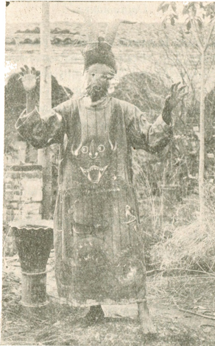
Danzante azteca de Tuxpan, Jal.

te ornamentales y de belleza plástica, como la de los listones, que consiste en bailar alrededor de un palo cogiendo listones de diversos colores y que al bailar se van entretejiendo; este baile se efectúa generalmente en el atrio de las iglesias. Los principales bailes y danzas son los siguientes: “Los Archileos”, “Santigos”, “Moros y Cristianos”, “Danza de los Labradores”, “El Toro de Cuero”, “Los Negros”, “Los Tecuanes”, “Los Vaqueros”, “El Gavilán” y “La Lagarta”.