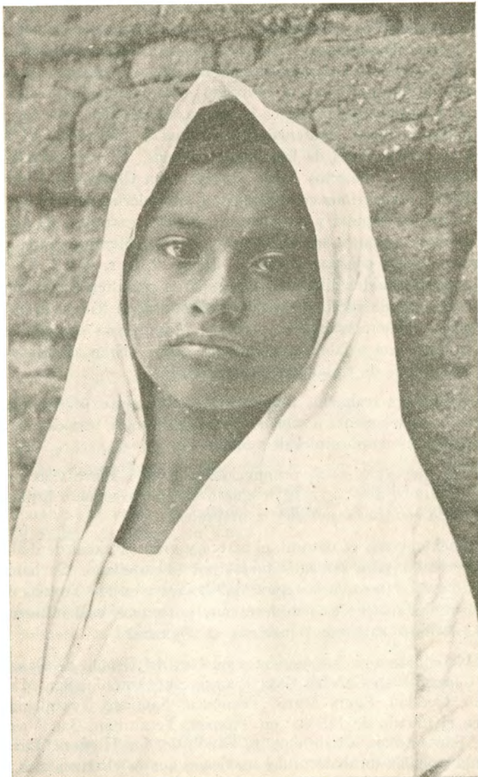
Niña azteca de Tuxpan, Jal.