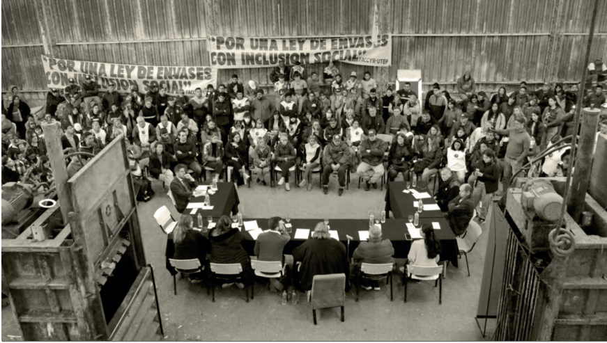
Miembros de la Comisión de Ambiente de la Cámara de Diputados sesionando en una planta recicladora de residuos.