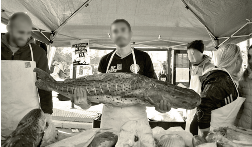
Actividad realizada por pescadores/as artesanales en la puerta del Congreso.

provincia de Buenos Aires. Allí, los diputados y diputadas miembros de la Comisión dispusieron una mesa en medio de un galpón donde funciona una cooperativa de reciclado, donde también sentaron a recicladores y cooperativistas que tomaron la palabra y formularon propuestas: “el objetivo de hacerla de ahí es porque entendemos que políticamente es necesario que los diputados y diputadas, que son representantes del pueblo, tengan la posibilidad de poder generar institucionalmente ámbitos en donde pueda tener el pueblo la misma voz que los diputados y diputadas”, explicó un asesor de Leonardo Grosso. 11 Ese día Grosso posteó fotos del evento en su cuenta de la red social X, como la que se muestra a continuación, y expresó: “Hoy es un día histórico. La comisión de Ambiente de @DiputadosAR se reunió en el Complejo Ambiental Norte III de Ceamse, en José León Suárez, junto a federaciones y cooperativas de Reciclado de todo el país” (Grosso, 2023).