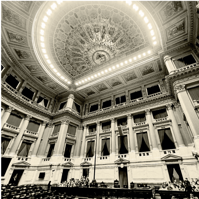
Interior del recinto donde sesiona el plenario de la Cámara de Diputados.